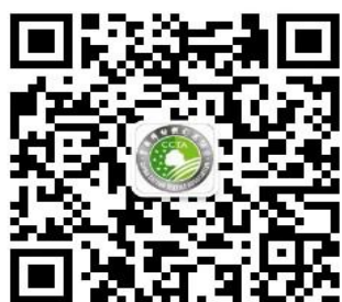
本协会微信公众号